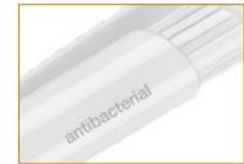
Hinweis im Schaft aufgedruckt: „antibacterial“