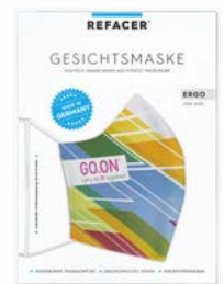
Ansicht in Einzelverpackung ca. 18 x 24 cm

— = Druckfläche 270 x 161 mm inkl. 3 mm Beschnittzugabe