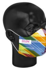
Ansicht der fertigen Maske