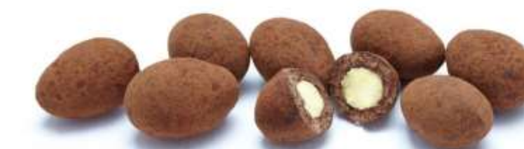
Trüffelmandeln mit Kakao (70 g)