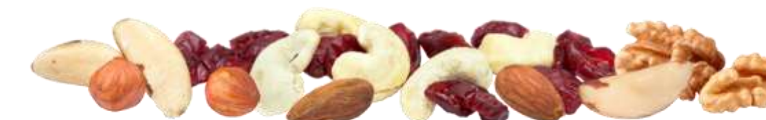
Edelnüsse & Cranberries (70 g)

Wählen Sie aus folgenden Snack-Kompositionen