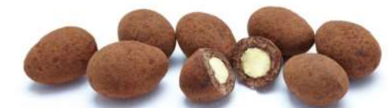
Trüffelmandeln mit Kakao (25 g)