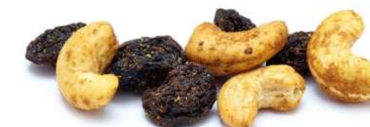
Cashewkerne mit Chili und Weinbeeren (15 g)