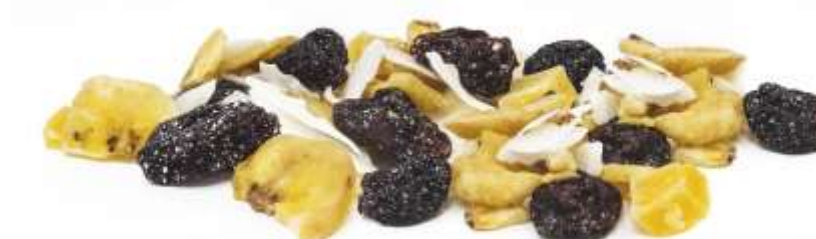
Fruchtmix „Mini Bites“: Mango, Kokos, Banane, Weinbeere (35 g)