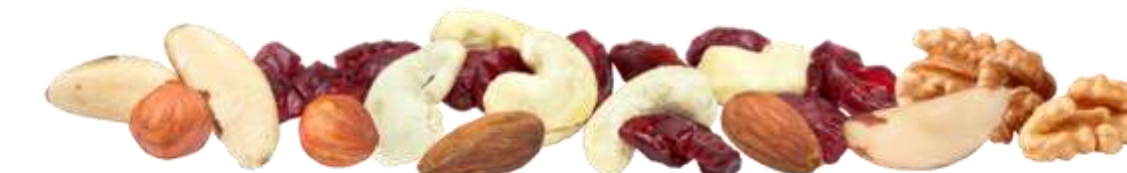
Edelnüsse & Cranberries (70 g)