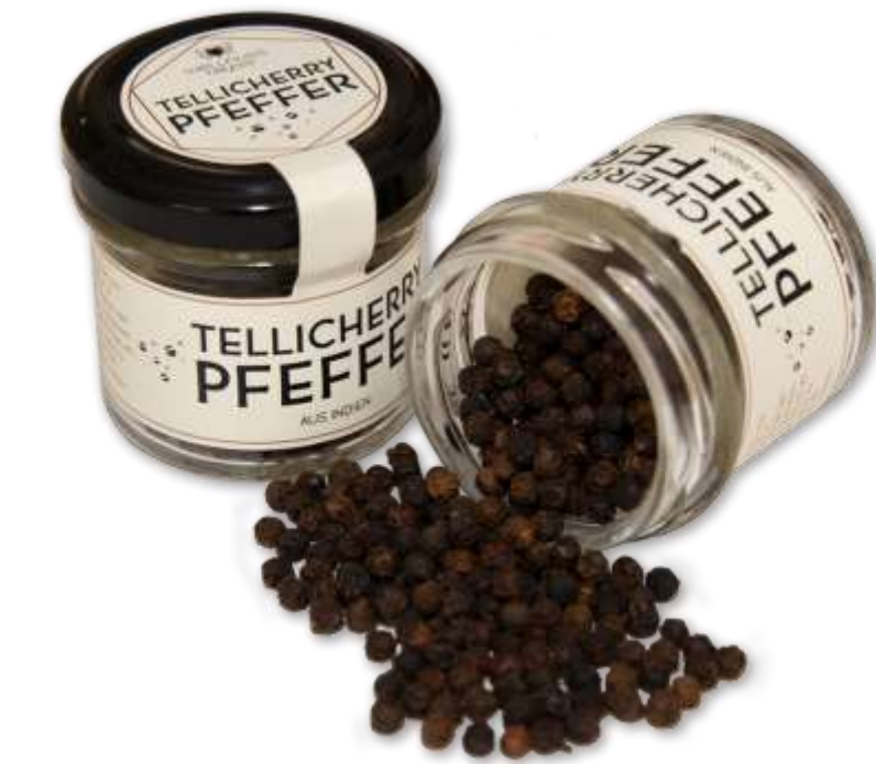
Gourmet Gewürze im Glas