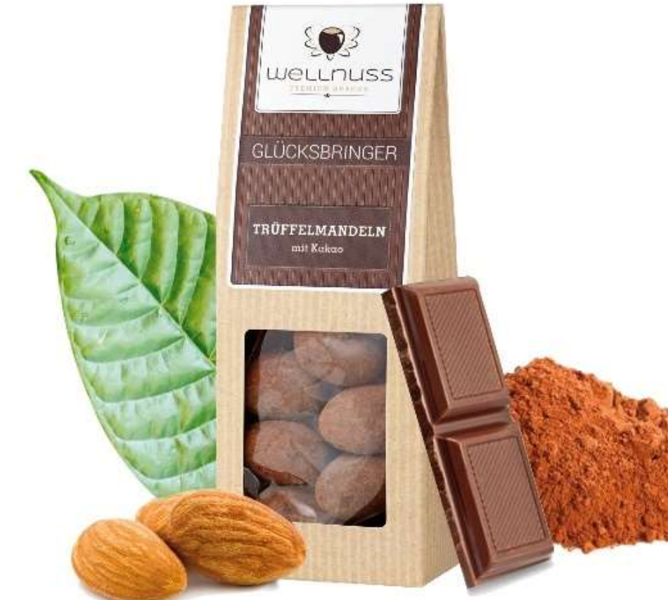
Glücksbringer Trüffelmandeln mit Kakao