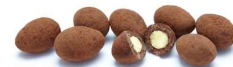
Trüffelmandeln mit Kakao (12 g)

Wählen Sie aus folgenden Snack-Kompositionen