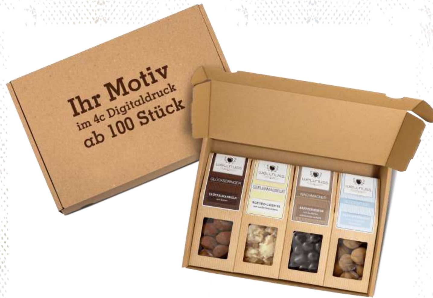
Faltschachteln im Versandkarton