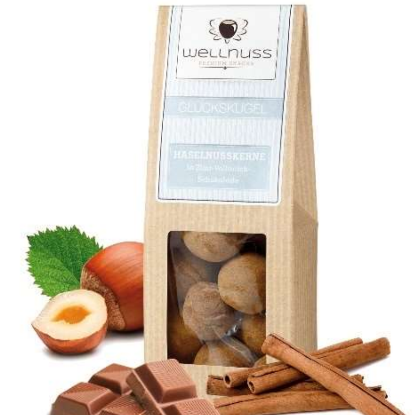
Glückskugel Haselnuss in Vollmilchschokolade und Zimt