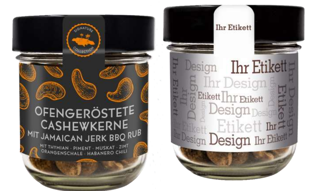
Snacks im Glas