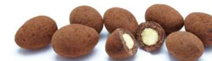
Trüffelmandeln mit Kakao (70 g)