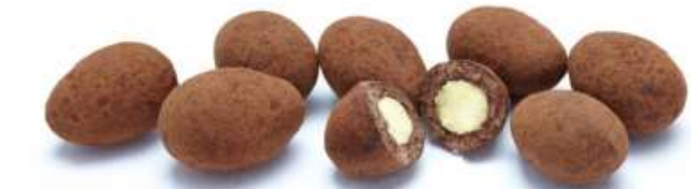
Trüffelmandeln mit Kakao (1 Stück)

Wählen Sie aus folgenden Snack-Kompositionen