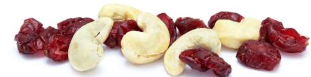
Cranberries und Cashewkerne (12 g)