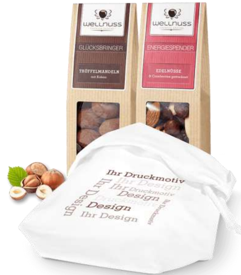
Faltschachteln im bedruckten Baumwollsäckchen