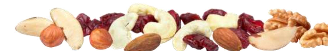
Edelnüsse & Cranberries (70 g)

Wählen Sie aus folgenden Snack-Kompositionen