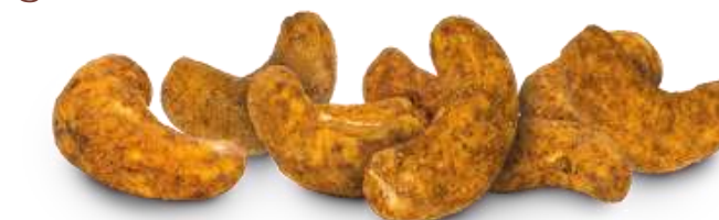
Ofengeröstete Cashews mit Jamaican Jerk oder Montreal BBQ Rub (35 g)