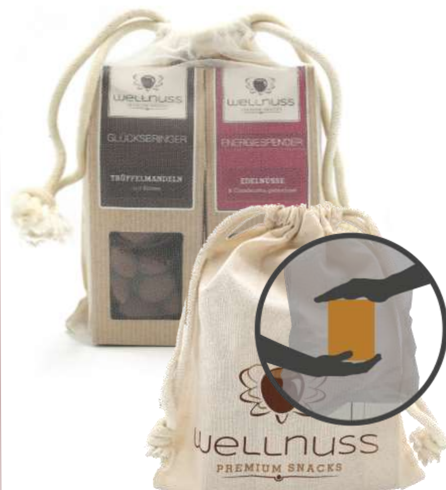
Fairtrade zertifiziertes Säckchen