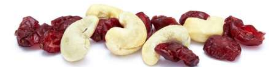
Cashewkerne & Cranberries (25 g)