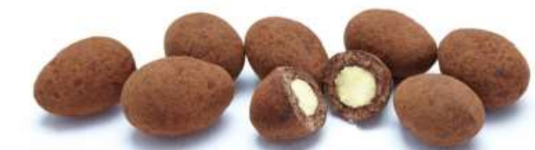
Trüffelmandeln mit Kakao (12 g)

Wählen Sie aus folgenden Snack-Kompositionen