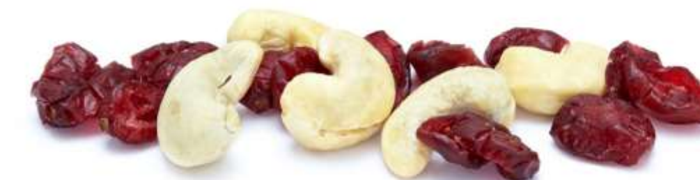
Cranberries und Cashewkerne (12 g)