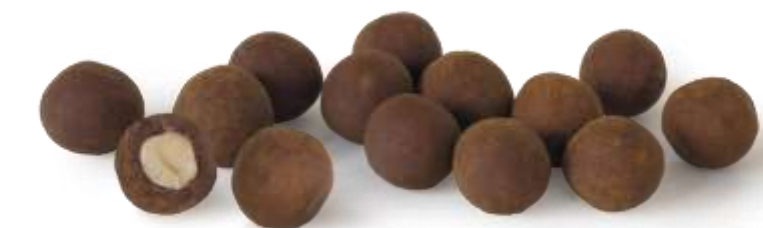
Haselnusskerne mit Vollmilchschokolade und Zimt (1 Stück)