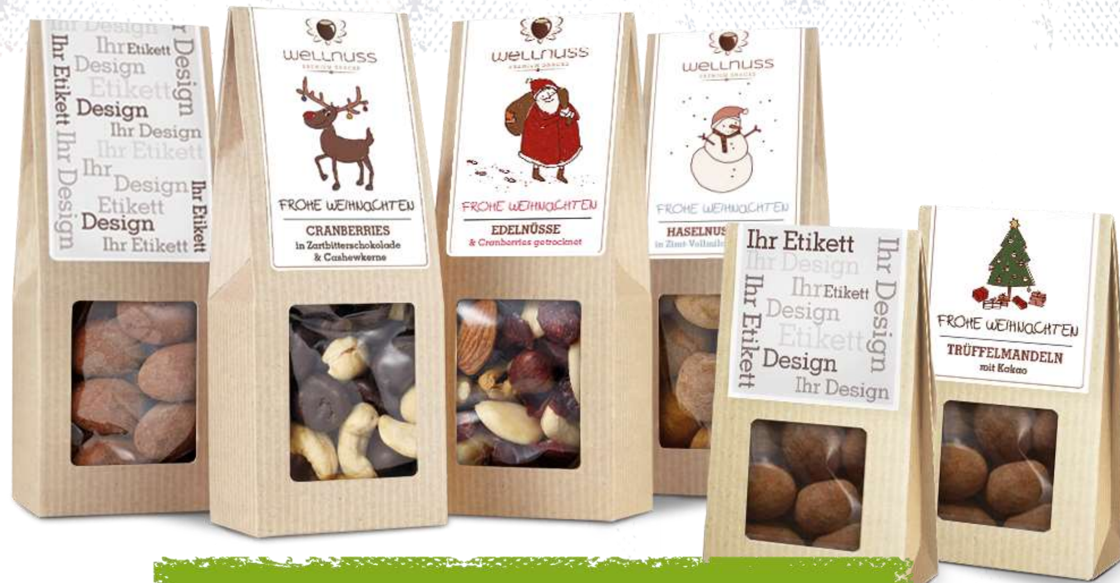
Faltschachteln und Mini Faltschachteln