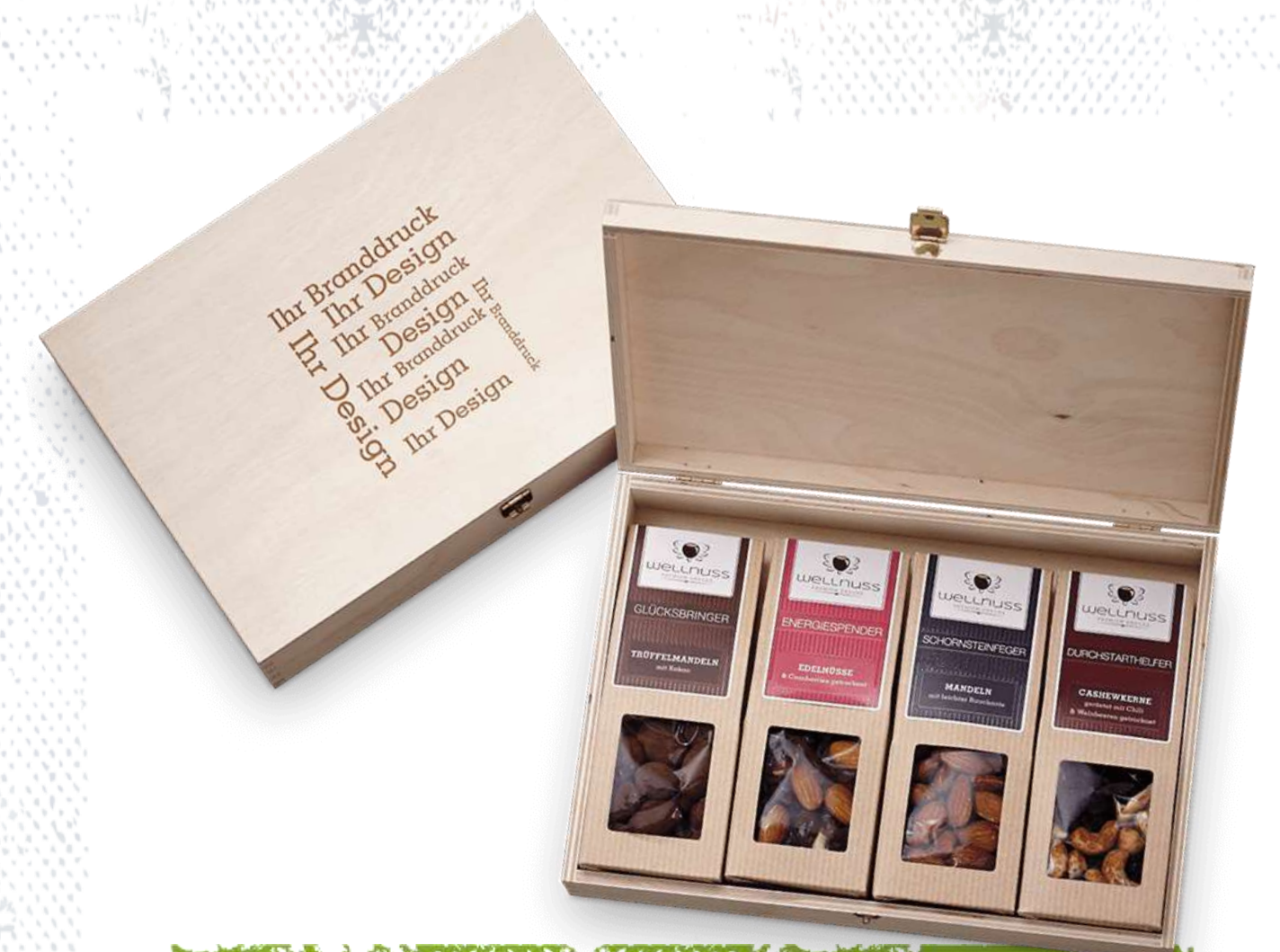
Faltschachteln in der Birkenholzbox mit Ihrem Logo