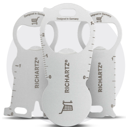
Ein RICHARTZ® Einkaufswagenlöser