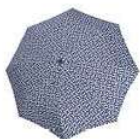
RS 4073 signature navy