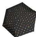
RT 7009 dots