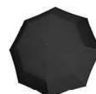
RR 7058 signature black hotprint