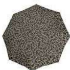
RR 7027 baroque taupe