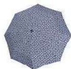
RR 4073 signature navy