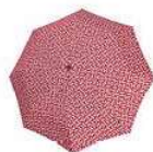
RS 3070 signature red