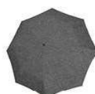
RR 7052 twist silver