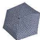
RT 4073 signature navy