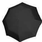
RS 7058 signature black hotprint