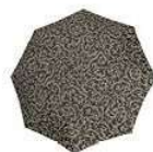
RS 7027 baroque taupe