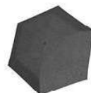
RT 7052 twist silver