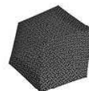
RT 7054 signature black