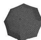
RR 7054 signature black