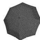
RS 7054 signature black