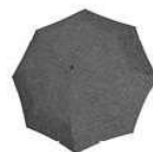
RS 7052 twist silver