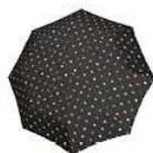
RS 7009 dots