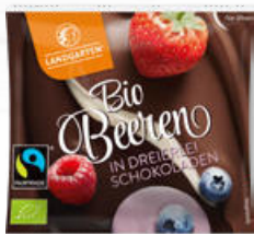
Bio Beeren in dreierlei Schokoladen (15g)