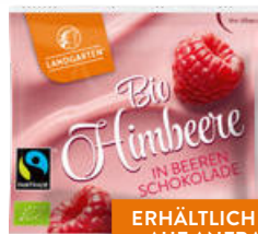
Bio Himbeeren in Beeren-Schokolade (15g)