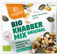
Bio Knabber Mix Original (10g)

Treffen Sie Ihre Wahl aus folgenden Sorten: