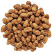
Österreichs Knabber Snacks