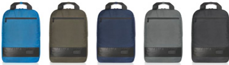
cyan (652) taupe (220) marine (3) anthrazit (10) schwarz (1)