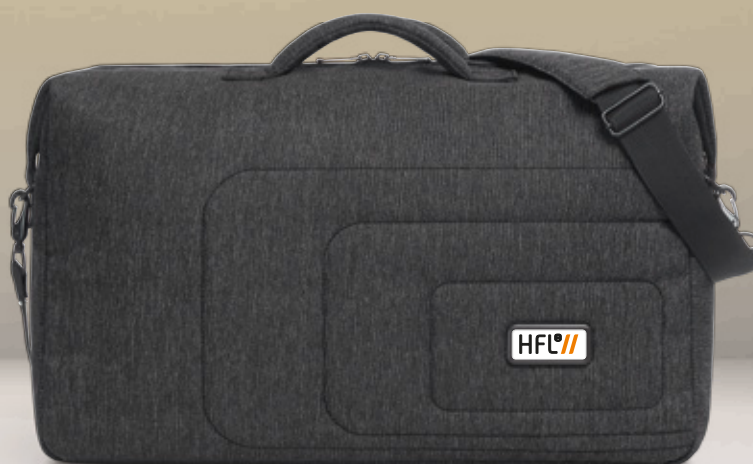
↑ 1816054 FRAME Sport-/Reisetasche