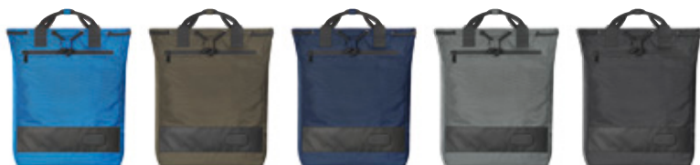
cyan (652) taupe (220) marine (3) anthrazit (10) schwarz (1)