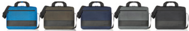
cyan (652) taupe (220) marine (3) anthrazit (10) schwarz (1)