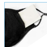
Einschub für optionalen Filter