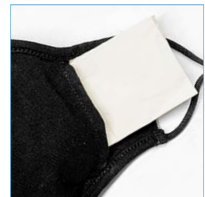
Einschubmöglichkeit für einen Filter / Tuch 1