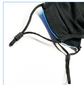
Elastikbänder sind verstellbar