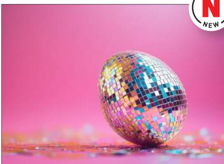
220125 Disco Ei