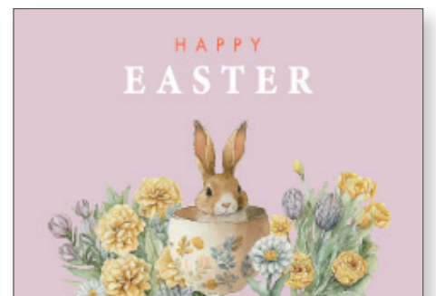
219168 Retro Easter Pink