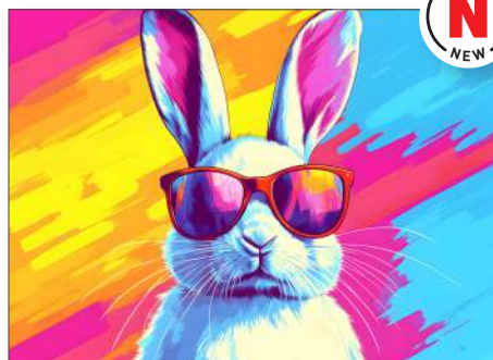
220126 Farbparty Osterhase