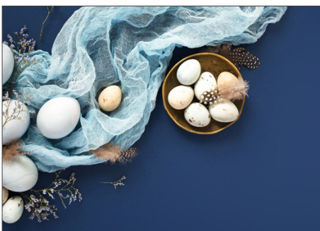
219165 Edle Ostereier