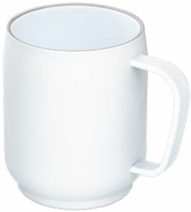
weiß 52681-WE Innenseite mit weißer Keramikbeschichtung