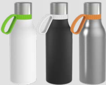
52656 RETUMBLER- myNIZZA II 420 + RING Thermo Trinkflasche