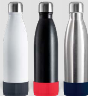
52457 RETUMBLER-myNIZZA + SLEEVE Thermo Trinkflasche