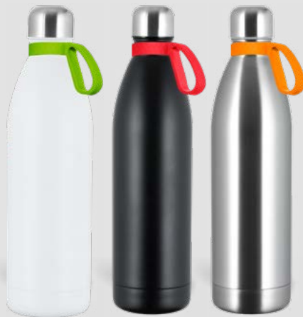
52495 RETUMBLER-myNIZZA XL + RING Thermo Trinkflasche