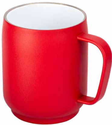
rot 52681-RD Innenseite mit weißer Keramikbeschichtung