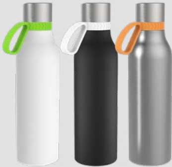
52655 RETUMBLER- myNIZZA II 600 + RING Thermo Trinkflasche