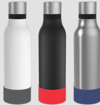
52655 RETUMBLER- myNIZZA II 600 + SLEEVE Thermo Trinkflasche