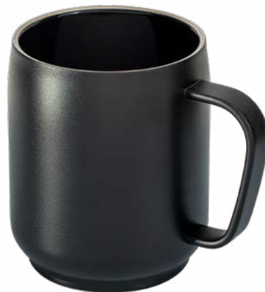
schwarz 52681-BK Innenseite mit schwarzer Keramikbeschichtung