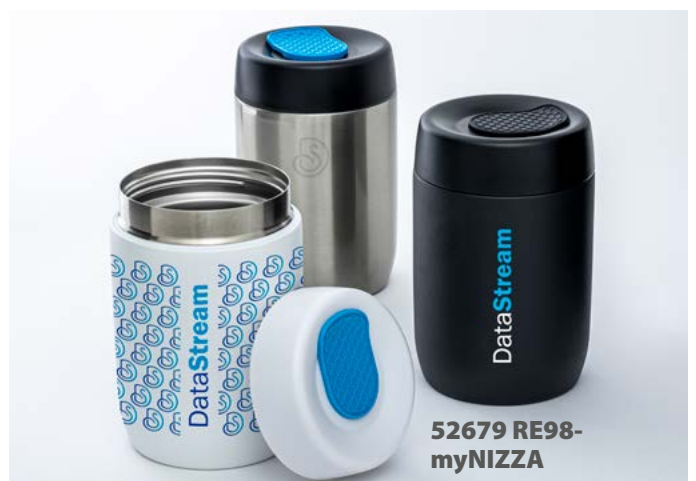
52679 RE98- myNIZZA