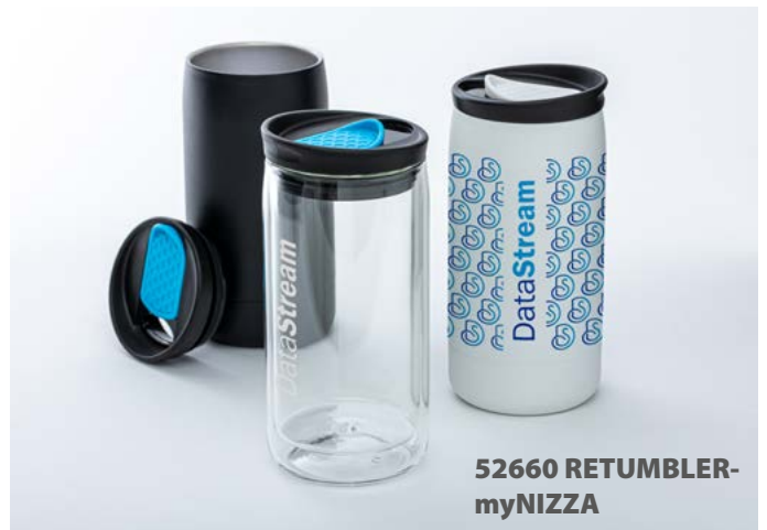
52660 RETUMBLER- myNIZZA