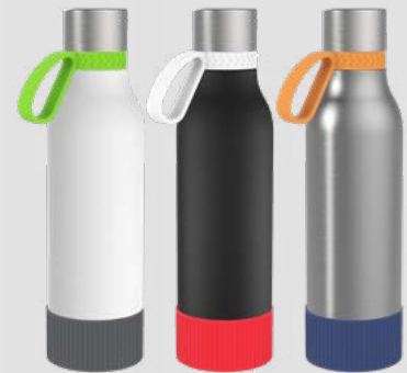
52655 RETUMBLER- myNIZZA II 600 PREMIUM Thermo Trinkflasche