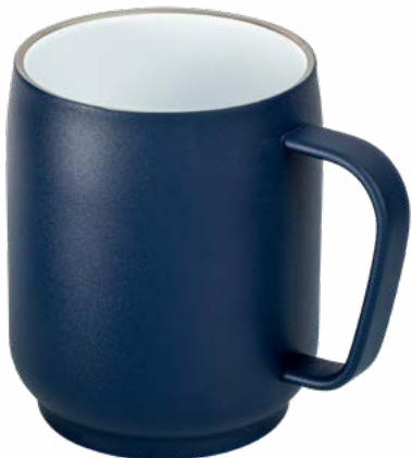
dunkelblau 52681-DBE Innenseite mit weißer Keramikbeschichtung