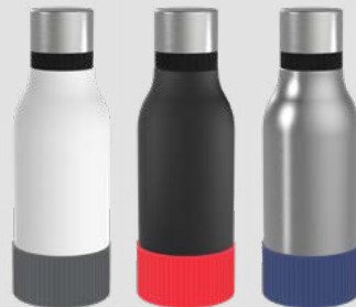
52656 RETUMBLER- myNIZZA II 420 + SLEEVE Thermo Trinkflasche