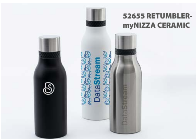
52655 RETUMBLER- myNIZZA CERAMIC