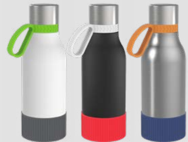
52656 RETUMBLER- myNIZZA II 420 PREMIUM Thermo Trinkflasche