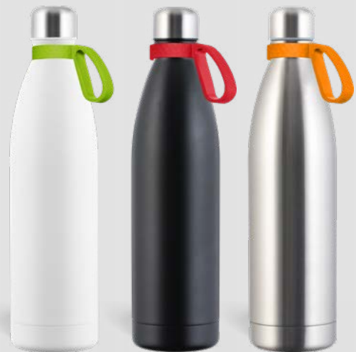
52531 RETUMBLER-myNIZZA XXL + RING Thermo Trinkflasche