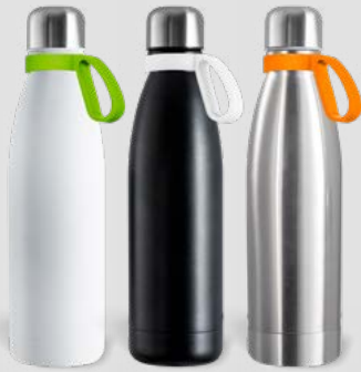
52457 RETUMBLER-myNIZZA + RING Thermo Trinkflasche