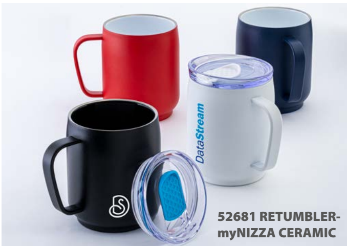
52681 RETUMBLER- myNIZZA CERAMIC