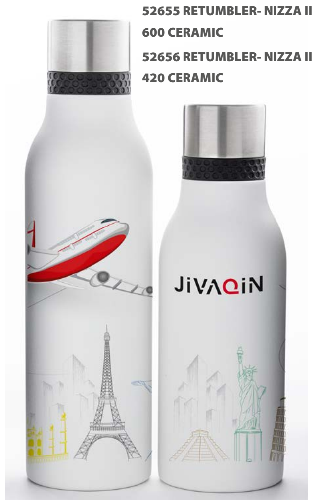
52655 RETUMBLER- NIZZA II 600 CERAMIC