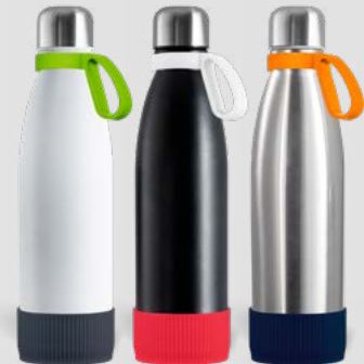
52457 RETUMBLER-myNIZZA PREMIUM Thermo Trinkflasche