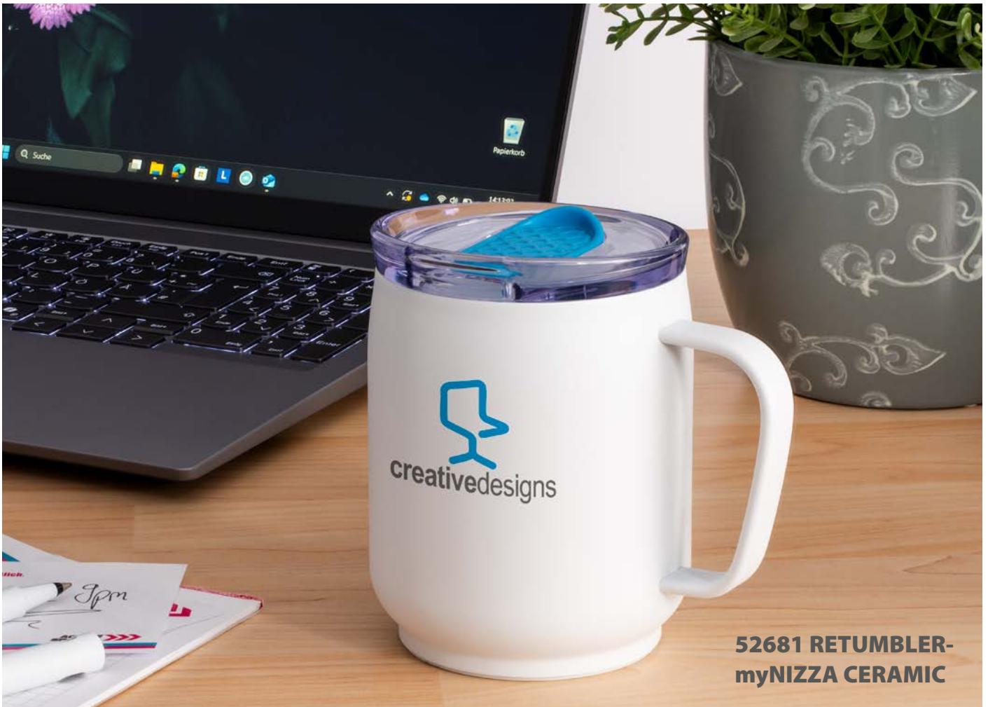
52681 RETUMBLER- myNIZZA CERAMIC