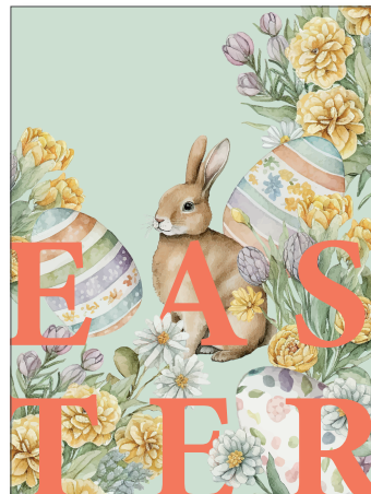
219169 Retro Easter Green