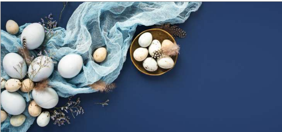
219165 Edle Ostereier