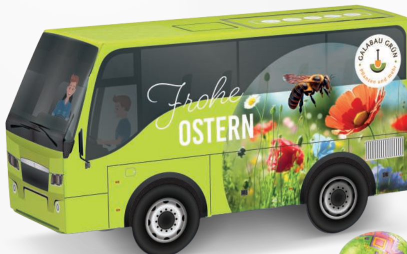
ART.-NR.: 1297 BUS PRÄSENT