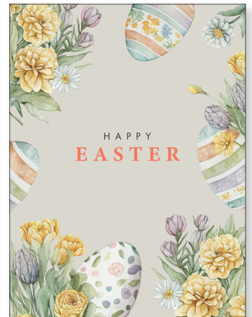
219170 Retro Easter Grey